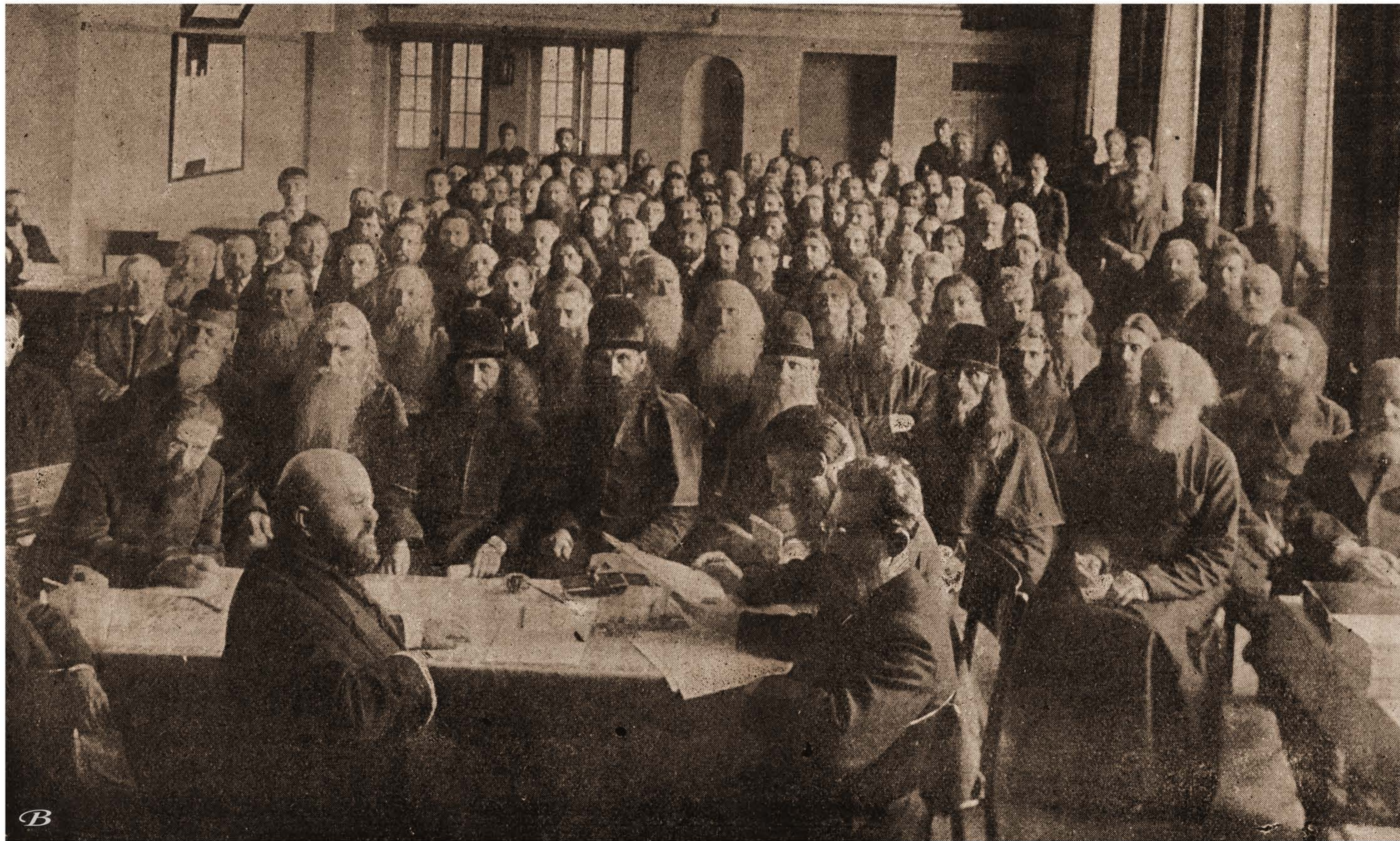
1-е засѣданіе XIV всерускаго съѣзда старообрядцевъ.