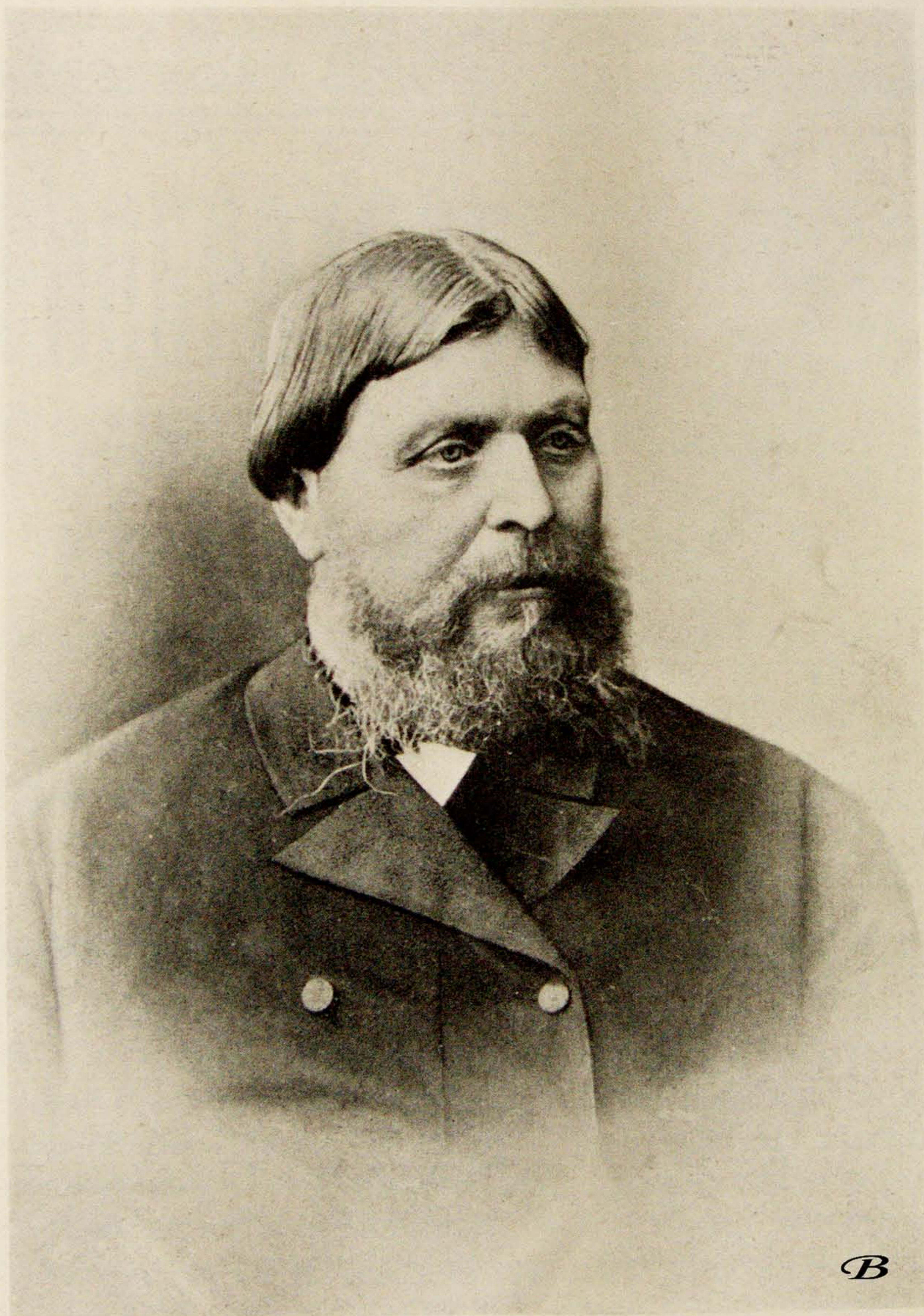
Н. А. БУГРОВЪ († 16 апрѣля)